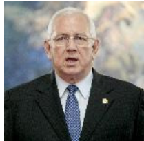
Micheletti califica ahora de "error" la expulsión de Manuel Zelaya de Honduras