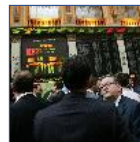
El Ibex 35 suma una nueva semana de subidas (+2,5%)

El presidente del Gobierno, José Luis Rodríguez Zapatero, adelantó hoy que las modificaciones o subidas de impuestos que anunciará el Gobierno cuando presente los Presupuestos para el año 2010 serán "limitadas y temporales", para poder preservar el principio de moderación fiscal que defiende el Gobierno. >