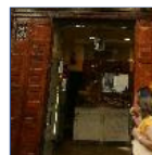
Las ventas del comercio minorista bajaron un 4,6% en julio