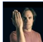
Gael García Bernal protagoniza el nuevo 'spot' de Intermón Oxfam