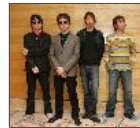
Noel Gallagher anuncia que abandona Oasis

La Oficina del Forense del Condado de Los Ángeles ha confirmado este viernes, más de dos meses después de la muerte del rey del pop, que Michael Jackson fue víctima de un "homicidio" por una sobredosis de propofol. >