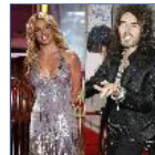
Britney Spears y Russell Brand ligan por telepatía