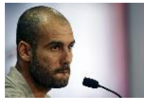
Guardiola (FC Barcelona): "Empezamos de cero"